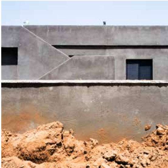
שייבה, רועי קופר